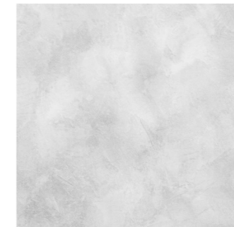
Macalu Concrete (program magazynowy)