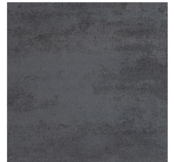
Concrete Black (program magazynowy)