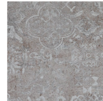
Modernism Warmgrey (program magazynowy)