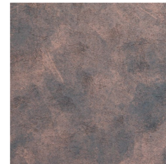
Vintage Copper (program magazynowy)