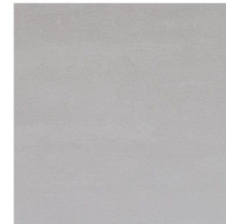
Oxid Grey (program magazynowy)

Panele dekoracyjne Design Solutions™ 4_kitchen odmieniają aranżację wnętrza, dodając jej wyjątkowego charakteru. Dzięki bogatej ofercie z łatwością dopasujesz płyty do stylu blatu i mebli kuchennych niezależnie od charakteru wykończenia wnętrza. Rekomendujemy stosowanie paneli dekoracyjnych Design Solutions™ 4_kitchen w miejscach nienarażonych na bezpośrednie działanie wody. Na zamówienie oferujemy także panele o podwyższonej odporności na wilgoć.