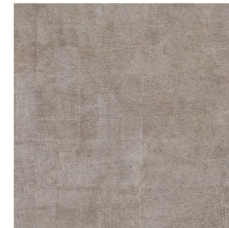
Plaza Stone (program magazynowy)