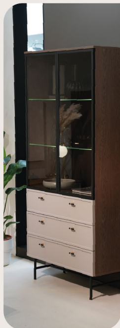
fronty i elementy mebli pokojowych, biurowych