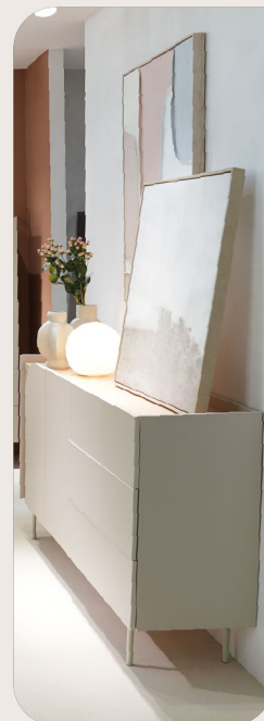
meble do sypialni