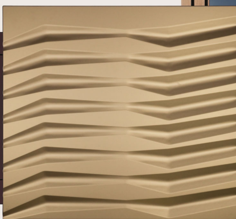
Roof Flow w kolorze Pearl Gold