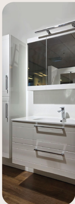
fronty mebli kuchennych i łazienkowych

Przygotowaliśmy katalog standardowych wzorów i kolorów. W przypadku zainteresowania niestandardowymi wykończeniami, możemy dostarczyć próbniki w ciągu 14 dni.