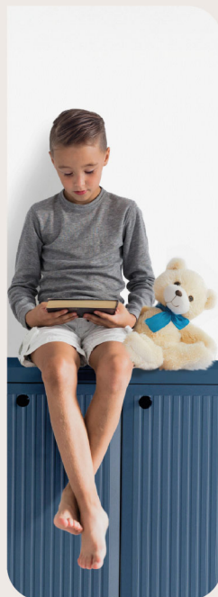
meble dziecięce i młodzieżowe